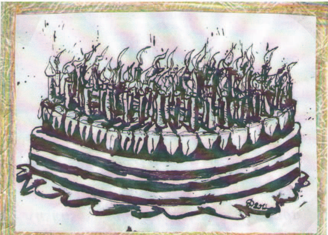
K čtyřicátému vydání Nájezdu s přáním všeho nejlepšího do dalších čtyřiceti čísel. Detail

Fanfáry, čtyřicetkrát hurá! Oslavná salva, pomalé rozbalování rudého koberečku, sváteční róba, v koutcích úst slavnostní viržinko, sochy z leštěného alabastru rozestavěné kolem a hlavně NÁJEZD číslo 40! Zní to neskutečně, důstojně, odvážně a odhodlaně. Za dobrou svojí existence prošel týdeník NÁJEZD řadou proměn, jeho distribuce byla rozšířena a řady jeho přispěvatelů zhoustli. všeobecné veselí – všeobecné povolení uzdy. Nájezd číslo 40 právě dokráčel na konec koberečku a průvodní slovo utichlo. "Tak tady mě máte!" Redakce Nájezdu