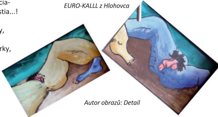
Autor obrazů: Detail