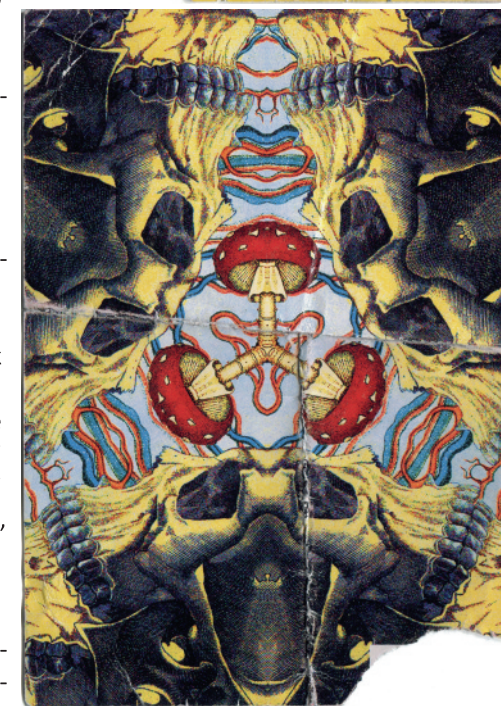
Vstupenka na koncert - rub i líc