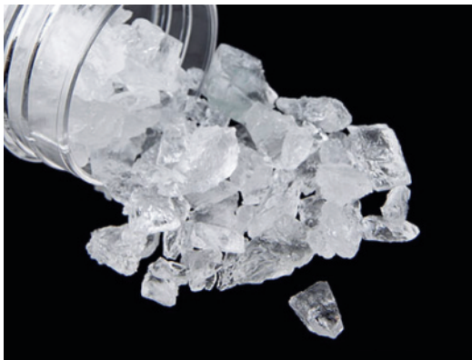
Krystal methamfetaminu nápadně připomínající bílé kamení.

na zostření smyslů a procesy myšlení. Pokud by se jednalo o více látek, pak by i kříže byly z jiných kamenů (krystalů), ale to není výslovně uvedeno. Jedná se tedy o jednu konkrétní látku. Pokud se podíváme na negativní projevy, které autor také zmiňuje: