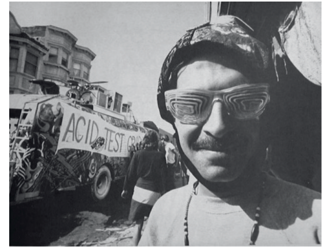
Merry Pranksters - prapůvoni hippies

Charitativní výprodeje poskytují svobodomyšlným hipíkům svůj sortiment a ustálí se móda: dlouhý vlasy, dlouhý vousy, džíny, etnické košile, bundy nebo mikiny, ideálně vše batikované a samozřejmě se musely nosit květiny, případně nenosit nic. Snažilo se žít v harmonii s přírodou. Poslouchala se psychedelická hudba a San Francisco (Grateful dead, Quicksilver messenger service, Jefferson airplane) s Los Angeles (Love, the Doors) bodovaly