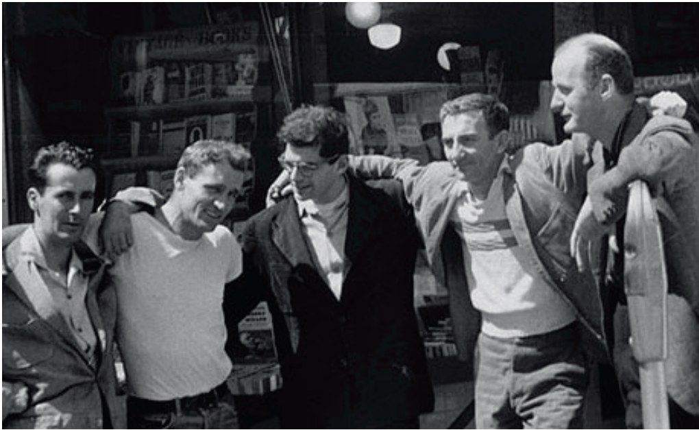
7. díl z výletu po subkulturách Hlavní představitelé beat generation