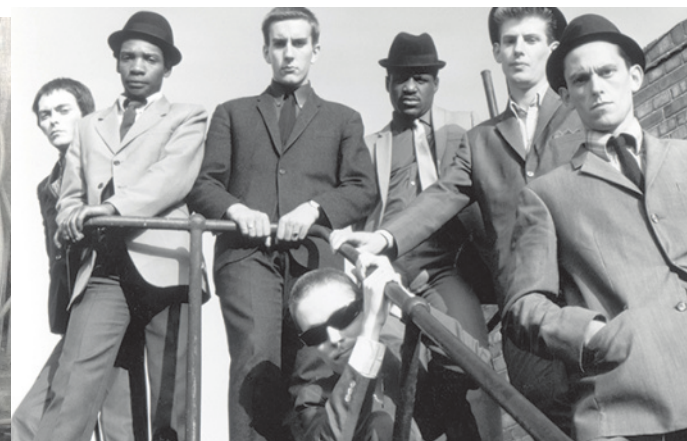
zleva: angličtí rudeboys; vprostřed: skinhead holí dívce Chelsea účes; vpravo 2tone kapela SPECIALS