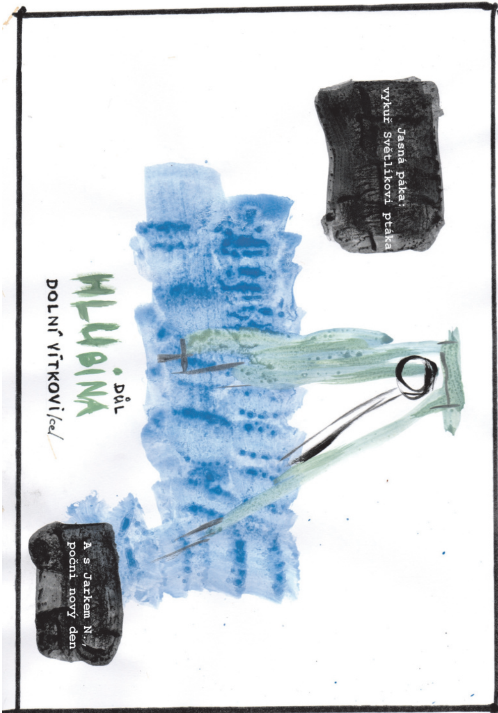
Autor kresby: Pan B