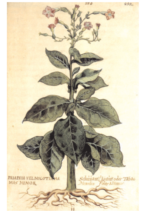
Imprese uživatele Franswazz s tabákem (nicotiana rustica). (zdroj: cz.pinterest.com).