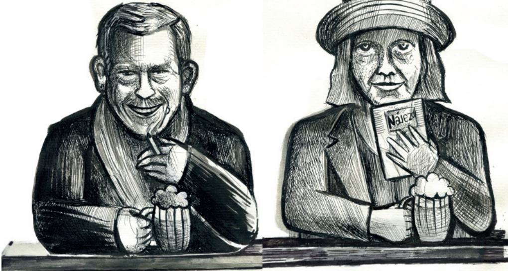
Autor kreseb: Filip Buryán

NÁHLÉ JEDINEČNÉ EXPERIMENTALNÍ ZASEDÁNÍ Dopojících