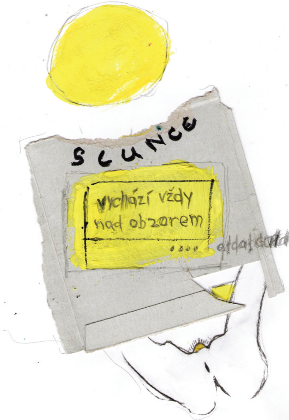
Autor: Pan B