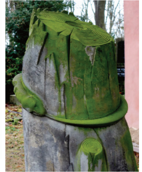
Obrázek týdne: Najedený had.