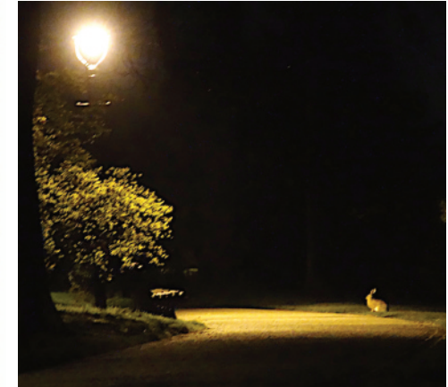
Obrázek týdne: Letenské vzpomínky na lockdown