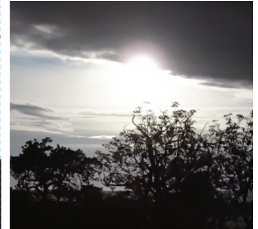
Obrázek týdne: Superúplněk, v noci jako ve dne.