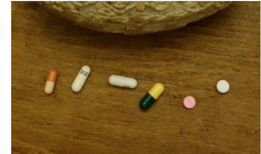
Obrázek týdne: Tvrdý život nebo party hard?