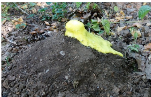
Pokus o imitaci sopky.