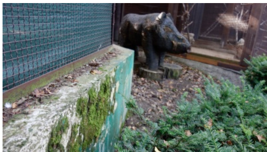
Exemplář (v popředí) živoucí bytosti z prvohor uprostřed čtvrtohorní minizoo.