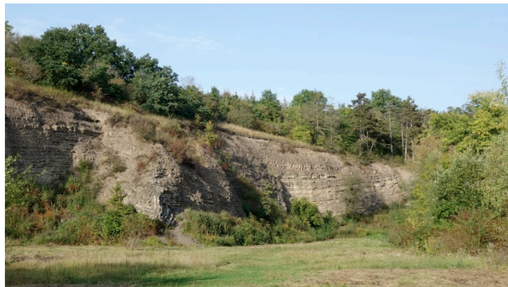
Žákův lom, hojně naleziště fosilií z prvohorních období silur a devon. Tato lokalita se nazývá Přídolí, které je samo o sobě světově uznanou epochou 423-419 miliónů let - tedy celý svět se musí učit vyslovit jeho název „Přídolí“.

Ale zpátky k akci, po instalaci potřebných rekvizit bylo 10 minut do startu. To se už trousili první účastníci. Šlo o to, že když 3 km trasa vede do cíle starého 420 miliónů let, pak jeden rok je cca 7 mikrometrů, tedy milión let je každých 7 metrů, případně jeden krok činí 100 000 let. Trasa vedla přes tři zastávky představující významné milníky v historii Země. První zastávkou byl konec druhohor a vymření dinosaurů. Dnes tuto událost upomíná monumentální kráter Chicxulub (části v Mexiku a části v Mexickém zálivu). Úkol byl velmi jednoduchý – hodit meteoritem do Zeměkoule a trefit se do onoho kráteru. Sice jednoduchý úkol, ale neskutečně obtížný na splnění. Další zastávkou byl počátek prvohor v místní minizoo,