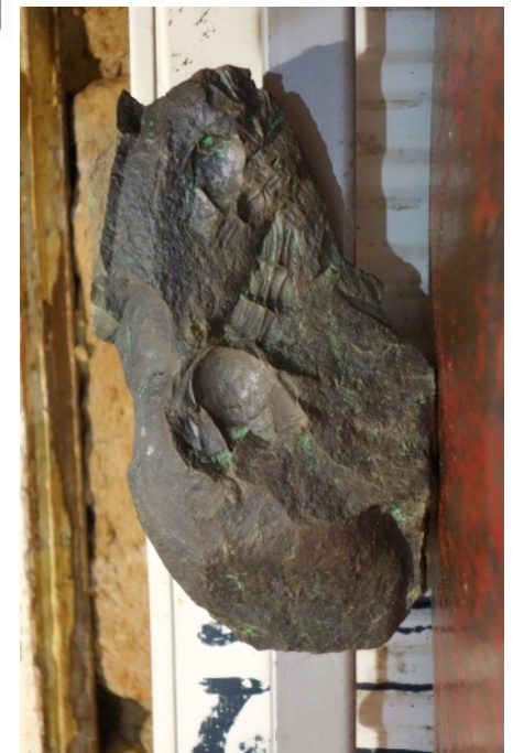
Obrázek týdne: Zkamenělý trilobitosaurus?

Vytiskni si Nájezd, přečti si jej a pak ho někomu dej.