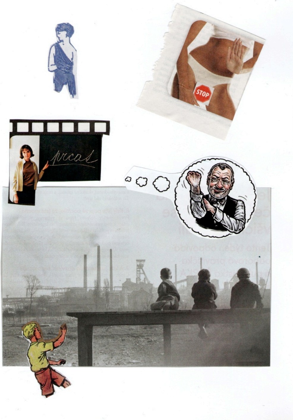
in memoriam Pan B.