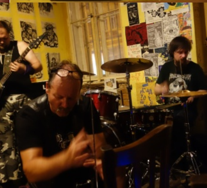
Momentky ze křtu a čtení z knihy Šroub do hlavy.