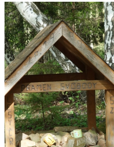
Obrázek týdne: Stáčená svoboda

Vytiskni si Nájezd, přečti si jej a pak ho někomu dej.