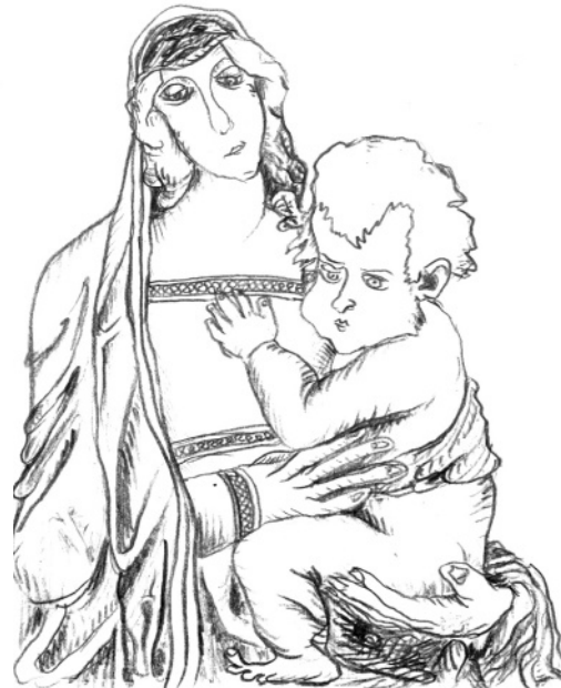
Autor kreseb: Detail