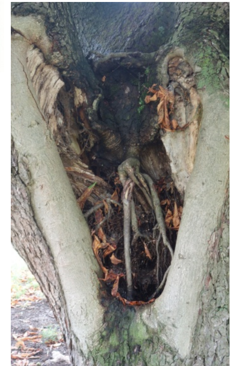
Obrázek týdne: kořeny v kmenu