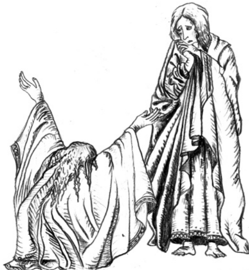
Autor kreseb: Detail