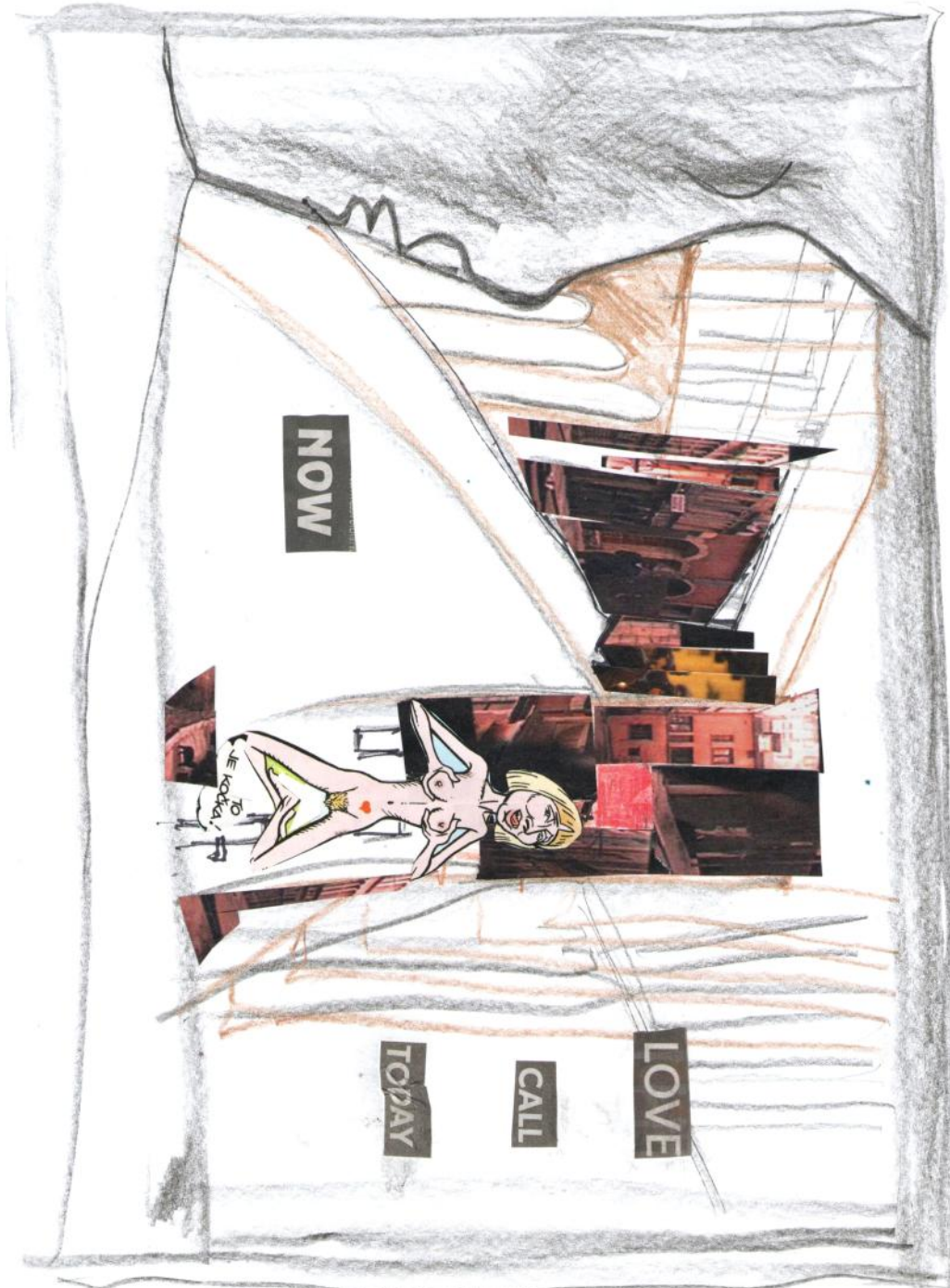
In memoriam Pan B