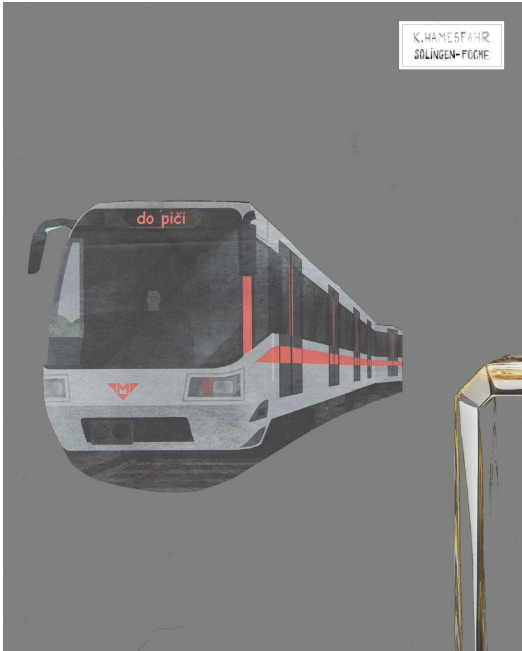
In memoriam Pan B