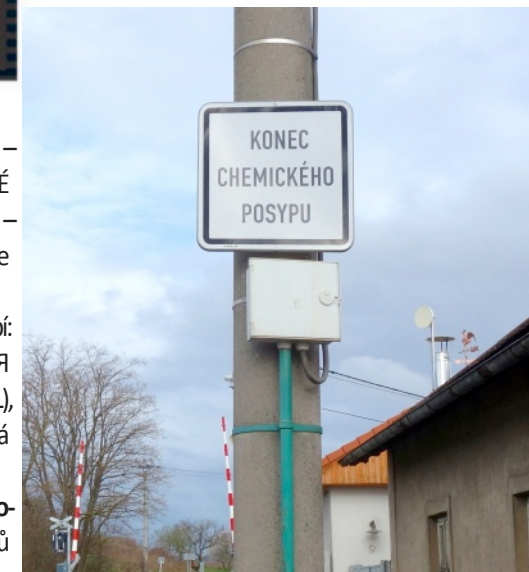
Obrázek týdne: Každá party jednou končí.

Anketa: Bude tuto zimu v Praze 30 dní nasněženo? Vyhodnocení ankety nalezenete uvnitř čísla.