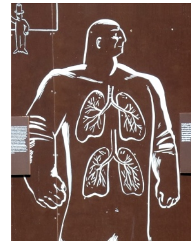
Obrázek týdne: Ahoj, nemáš něco málo na brčko?