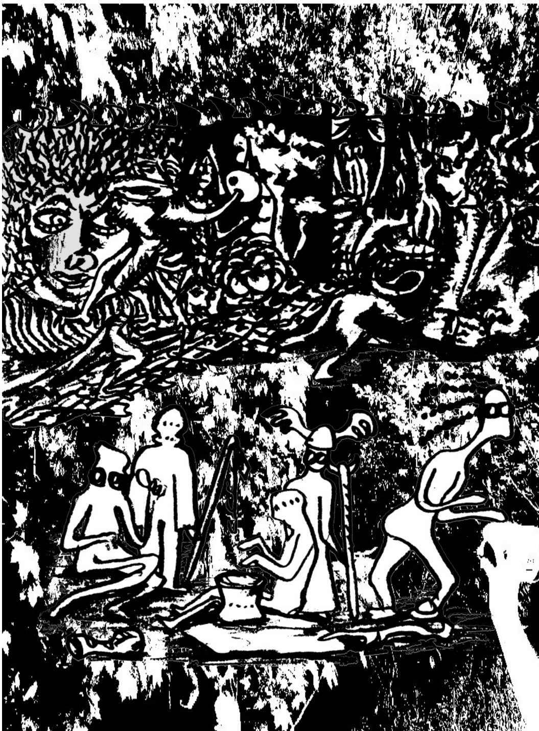
Autor: Detail + pirátský Nájezd