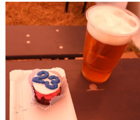
Obrázek týdne: Pivo a "to free" dortík

ALTSTEINZEITLICHE KNOCHENKLANGBILDER. Kde: Týn nad Vltavou, Semenec, kdy: večer, vstup: v rámci akce.