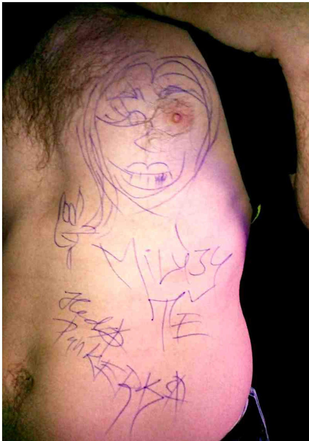
Autor: Heda Punkerka