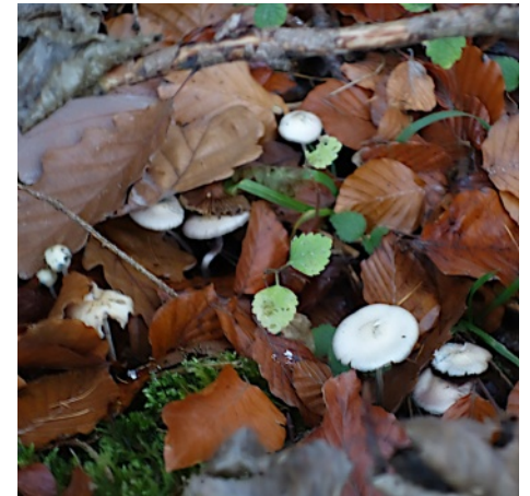
Obrázek týdne: Podzimní zátíší

Vytiskni si Nájezd, přečti si jej a pak ho někomu dej.