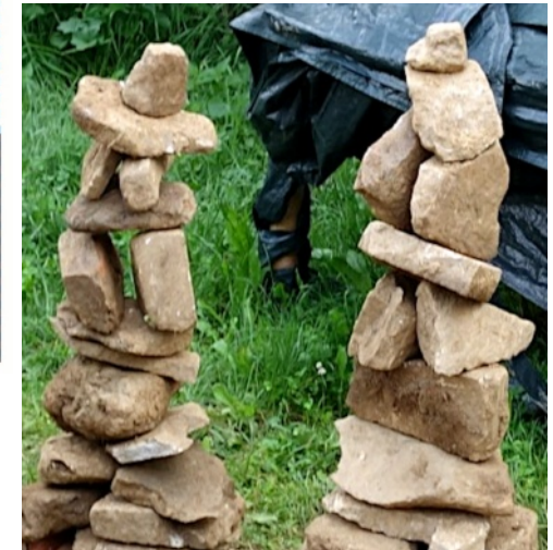
Obrázek týdne: O čem pak si povídají?

Vytiskni si Nájezd, přečti si jej a pak ho někomu dej.