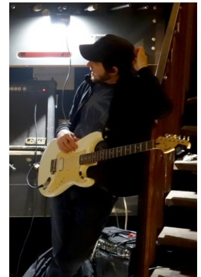
Obrázek týdne: Takže jam?

Vytiskni si Nájezd, přečti si jej a pak ho někomu dej.