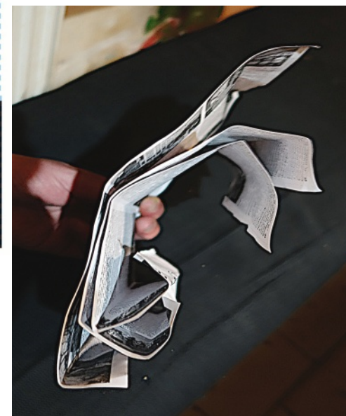
Obrázek týdne: Nájezd 666?

Vytiskni si Nájezd, přečti si jej a pak ho někomu dej.