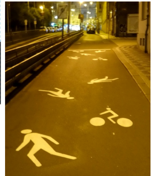
Obrázek týdne: Plac volného pohozu

Vytiskni si Nájezd, přečti si jej a pak ho někomu dej.