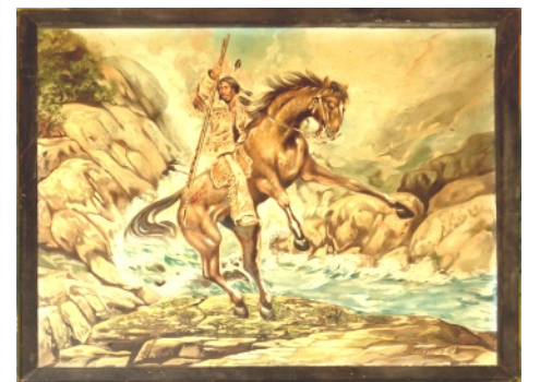
Obrázek týdne: Indián lovící kamení

Vytiskni si Nájezd, přečti si jej a pak ho někomu dej.