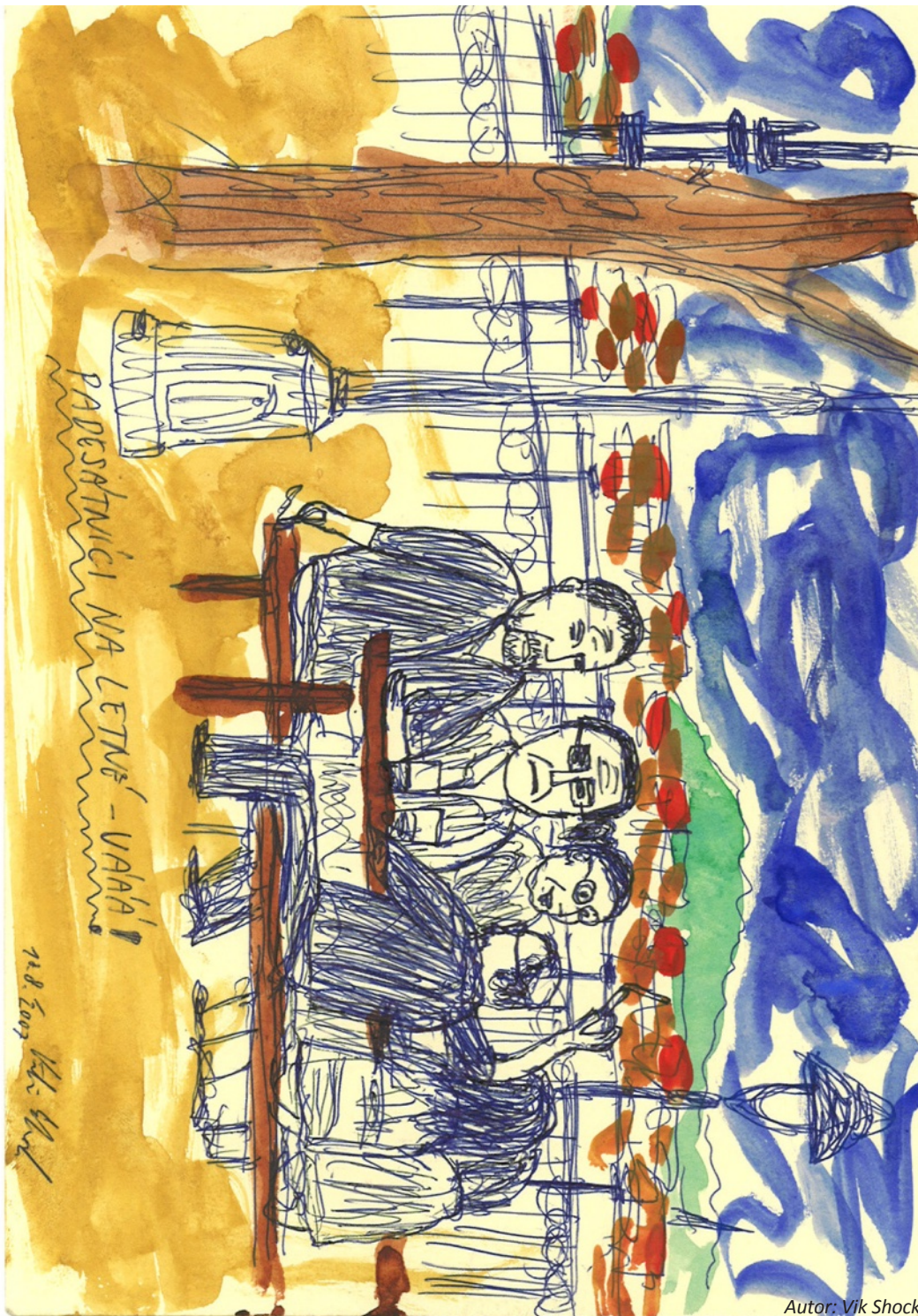
Autor: Vlk Shock